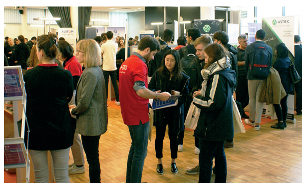
Forum Bac+5 - édition 2019